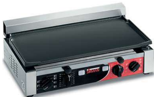
TOP L TIMER