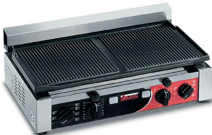
TOP R TIMER