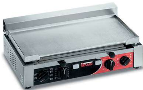
TOP X TIMER