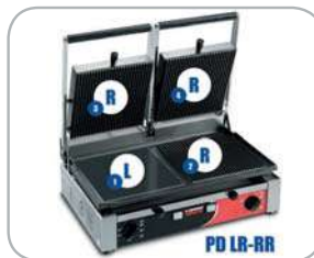
Legenda modelli Models key